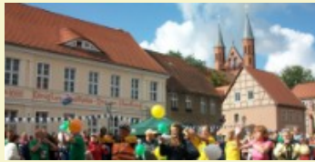
Kyritz? Wo liegt denn das?